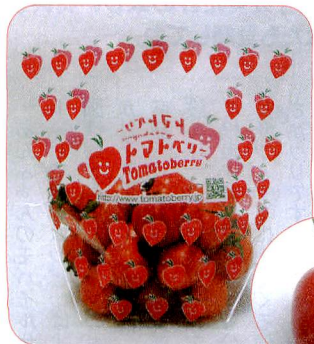
トマトベリーはこのパッケージが目印