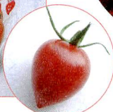
愛らしい形のトマトベリー