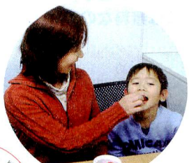
「フルーティーなので、 おやつ感覚で食べられ ますね」と涼子ママ